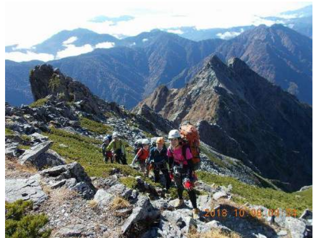
奥又白から前穂高岳へ