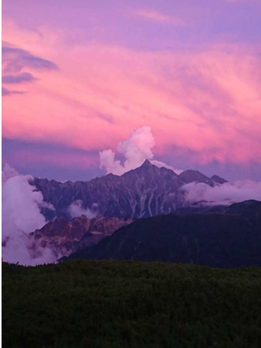
『 三俣山荘から望む槍ヶ岳 』