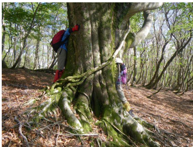
「 ぶな巨木計測中の風景 」