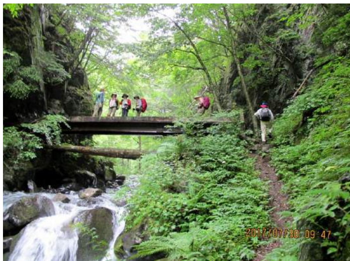
徳本峠へのクラシックルート