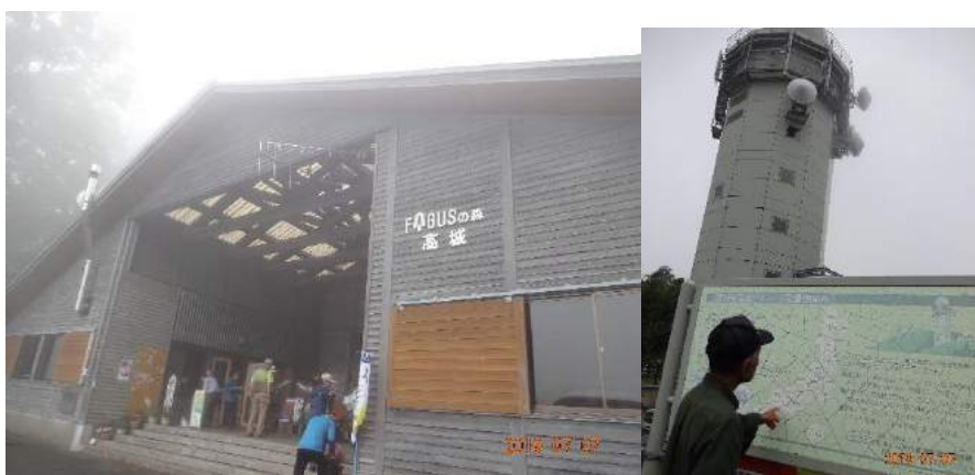
ファガスの森ビジターセンター