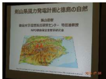
徳島県勤労者山岳連盟

徳島県中央部の剣山の東に連なる天神丸～高城山の山系に1基 2300Kw～3450Kwの風力発電機を42基建設計画に対して徳島の山岳4団体が反対運動を始めました。この地域には貴重な植物も多く、動物も生息しています。絶滅危惧種のツキノワグマ、サンショウウオ類の心配です。建設に伴い大型資材の搬入のための道路改修が必要です。費用は誰が負担するのか。（2Mwクラスの風車の長さはタワートップ 28m、タワーボトム 4m、発電機 18.5m、ブレード 39mの荷物です。全てトレーラーで運ぶ計画ですので、既存の道路を拡幅しな