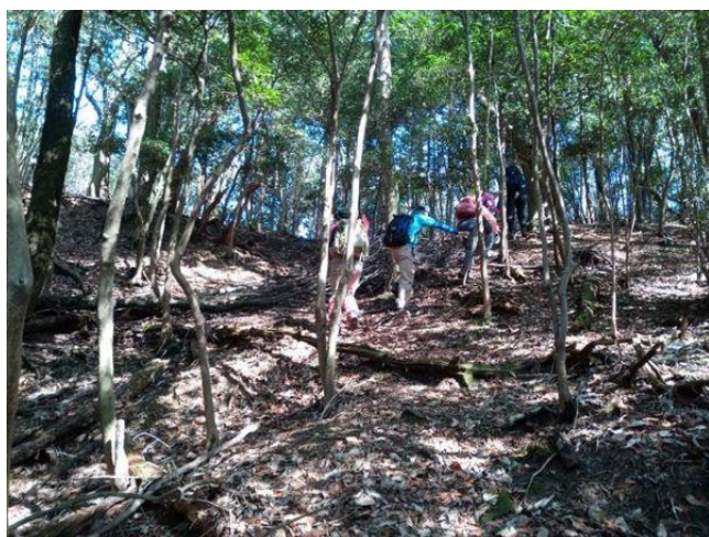
P363の尾根を目指して