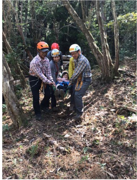
ネットとストックを使って運ぶ