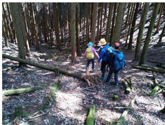
谷筋合流地点へ下っていく