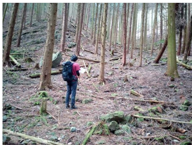
谷筋の合流から 右端4本目の谷筋を登る