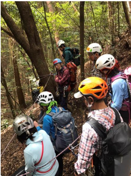
斜面をカラビナスルーで通過練習