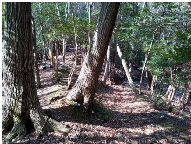
最初の分岐ポイント

特に谷沿いの道で地図を見て等高線の幅や形が実際に見てみるとこのような谷になるかと実感でき、また地図上では見落としそうな四つの谷が集まったところは想像をはるかに上回る光景であった。事前のシミュレーションをしていたからこそこのような驚きもあり、歩いた箇所は写真が必要ないくらい鮮明に記憶に残っている。これからも読図を通じて山行の楽しみがより広がるよう活用していきたいと思う。時間を超過して丁寧にご指導いただいたN講師、共に試行錯誤しながら歩んでくださった仲間の皆様に感謝いたします。(山友会N堀)