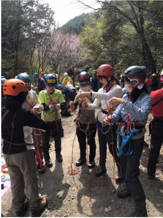
ロープの結び方 練習