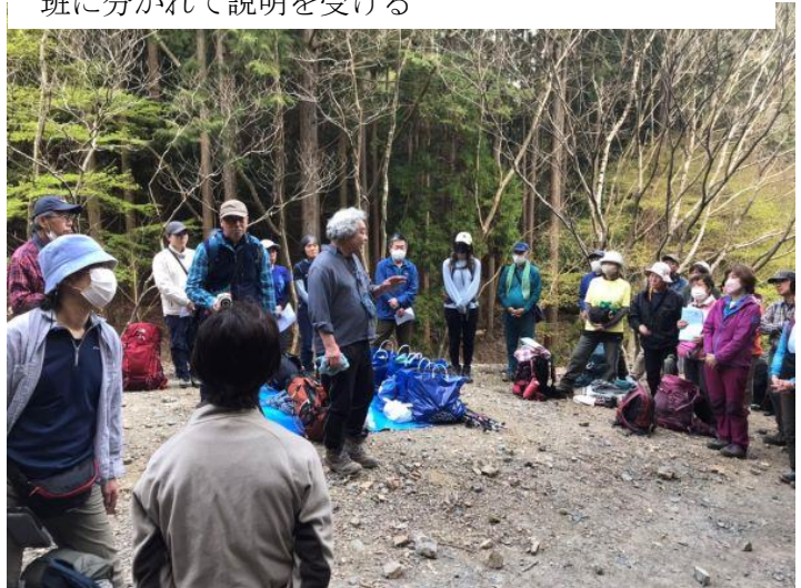
閉会式 あいさつ 友永滋賀県連会長