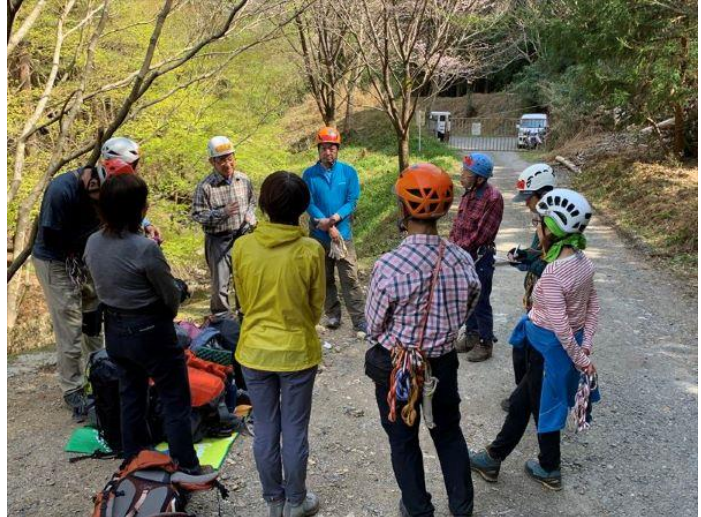
班に分かれて説明を受ける