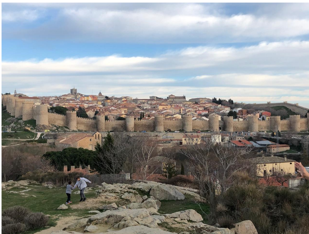
『アピラ(スペイン)の旧市街』